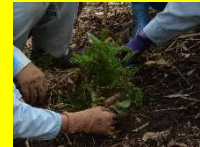
オオシラビソの移植