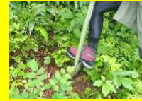
オオシラビソの採取