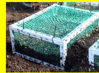
工作物の設置 （保護網、看板等）