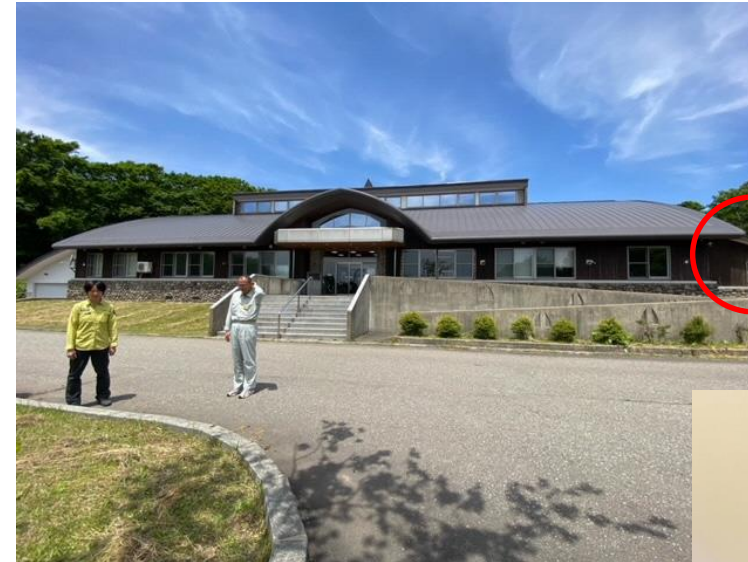
猛禽類保護センター