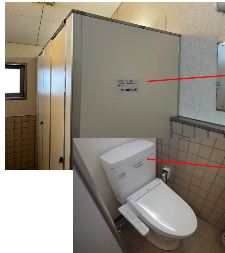
更新後の女子トイレ