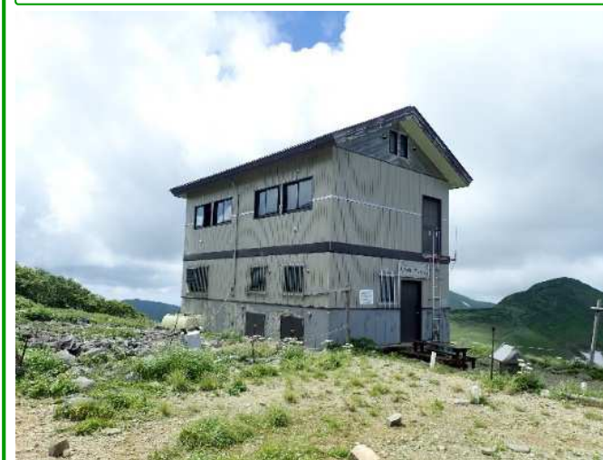
大朝日岳山頂避難小屋

注意事項：小屋全面に足場を設置しますので、小屋内への出入りは2階入口となる予定です。なお、トイレは通常通り使用できます。