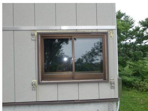
面格子取付部の破損